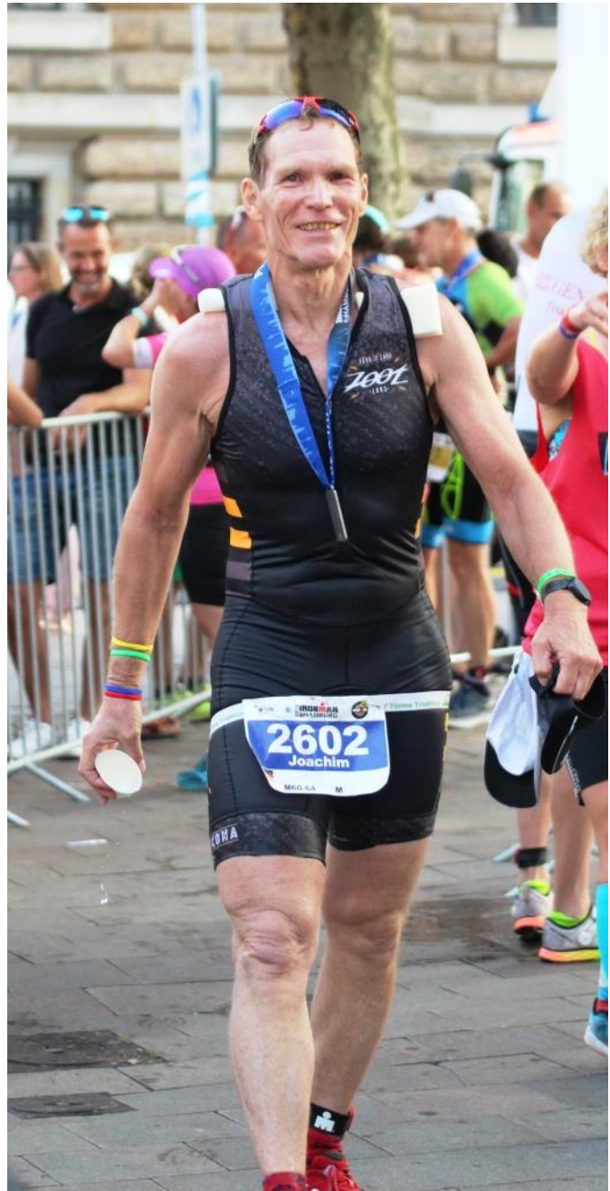
Zu Recht stolz und zufrieden im Ziel angekommen!!