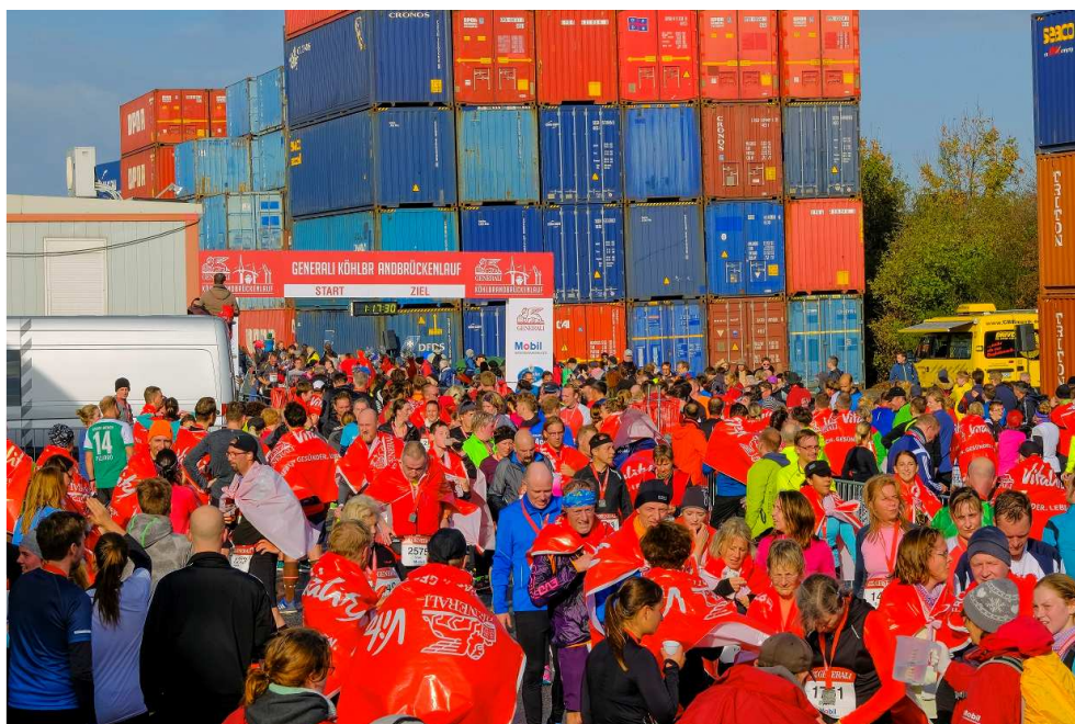
Start und Ziel zwischen den hoch gestapelten Container im Hamburger Hafen!